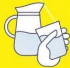
BUVEZ DE L'EAU